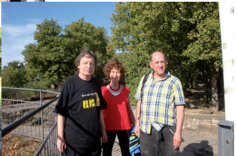
Abendessen in Hattenheim