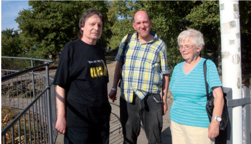
Auf der Loreley